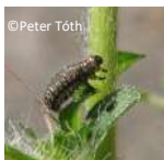
Larve sur tige (plusieurs stades larvaires)