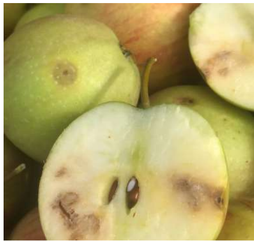
Dégâts sur pomme

Au niveau national, on a enregistré des détections :