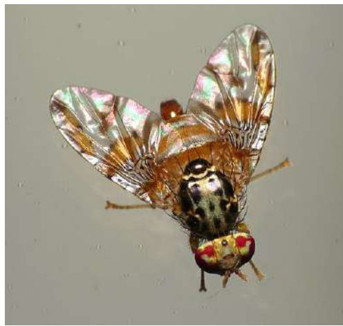
Mouche méditerranéenne

Un dispositif plus spécifique visait la mouche orientale des fruits ( Bactrocera dorsalis ) et la mouche du pêcher ( Bactrocera zonata ), piégées respectivement depuis 2019 et 2020 dans la région. Au total 105 pièges (dont 22 sur le MIN de Rungis) ont été mis en place sur une zone encore élargie par rapport à la surveillance 2022. Les captures ont augmenté, notamment très fortement pour Bactrocera dorsalis désormais détectée dans les 8 départements de la région, avec les captures en 2023 autour de Versailles dans les Yvelines. La majorité des captures de toutes ces mouches (50%) reste observée à proximité de Rungis et Orly. Aucune larve de Bactrocera n'a été détectée, ce qui ne permet pas de conclure à la présence d'un éventuel foyer. En revanche, la présence parfois importante de larves de mouche méditerranéenne Cératitidis capitata a été observée dans des jardins familiaux du Val-du-Marne comme dans des vergers de pommiers du Val-d'Oise.