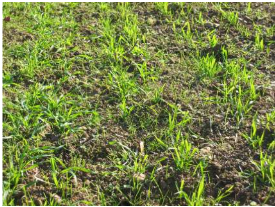
La gestion du désherbage, une thématique prioritaire

Au total 47 projets, dont 23 au titre de la thématique prioritaire, ont été déposés pour un montant de subvention totale demandée d'environ 13,4 millions d'euros. Du fait de l'enveloppe budgétaire limitée, et au terme de l'instruction de chacun des dossiers, 22 projets lauréats aux profils variés ont été retenus, permettant de couvrir un large éventail d'enjeux y compris dans les territoires ultra-marins.