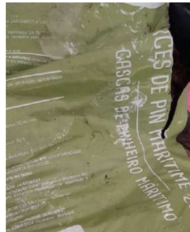
Ecorces de pins portugais, un risque d'introduction du nématode