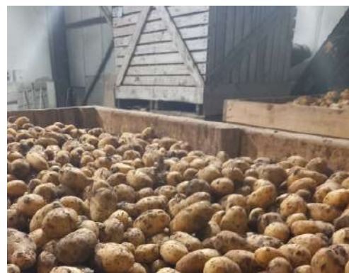
S'assurer de la qualité des plants fermiers

La baisse en 2023 des surfaces de plants de pomme de terre certifiés et une hausse des refus de certification (notamment pour des raisons sanitaires) conduisent à des difficultés d'approvisionnement pour la campagne 2024. La production de plants fermiers est autorisée sous certaines conditions. Un accord interprofessionnel encadre cette production et en définit les modalités.