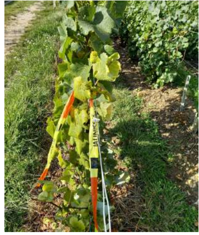
Pieds diagnostiqué bois noir

Trois vignes associatives ont également été inspectées.