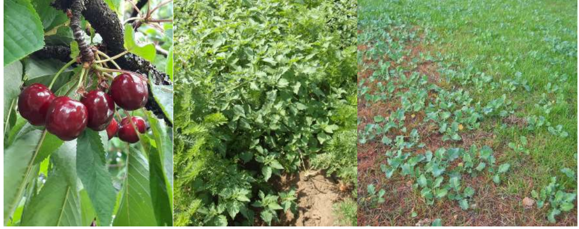
Gestion de la drosophile, gestion des adventices, à chaque filière ses priorités

Suite à ce comité, un appel à manifestation d'intérêt (AMI) a été publié le 19 décembre sur le site du ministère en charge de l'agriculture. Les porteurs de projets peuvent soumettre des lettres d'intention de contribution en réponse aux plans d'action.