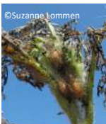
Nymphe à la base des feuilles