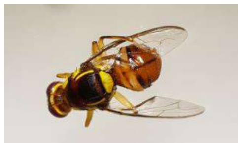
Bactrocera dorsalis piégée en Ile-de-France

afin de conduire une expérimentation de lutte contre ce ravageur par la technique de l'insecte stérile. Une première étude avait été conduite en 2021-2022 avec une autre souche. Cette mouche orientale des fruits, importée par fruits exotiques (principalement la mangue) est piégée régulièrement dans la région depuis 2019 surtout dans des jardins à proximité d'Orly, de Roissy et du marché de Rungis.