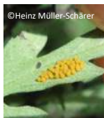
Œufs sur feuille

Ophraella communis : un coléoptère contre l'ambroisie !