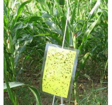
Piège chromatique dans un maïs

Aucun organisme réglementé n'a été détecté.