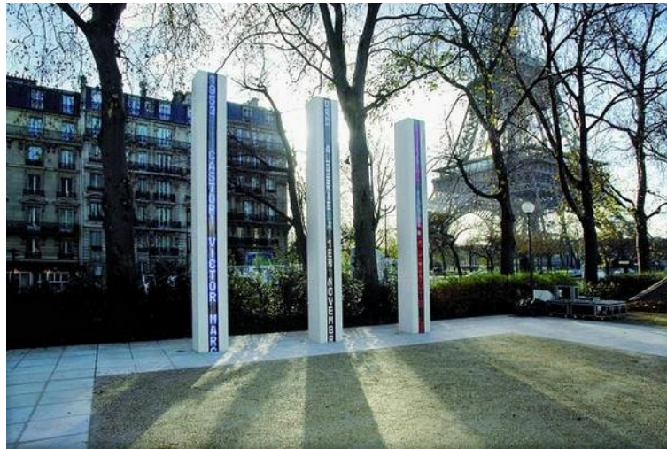
Mémorial national de la guerre d'Algérie et des combats du Maroc et de la Tunisie Quai Branly à Paris

La date du 5 décembre a été instituée journée nationale en souvenir des morts en Algérie, Tunisie et Maroc entre 1952 et 1962. Cette date déconnectée des événements qui ont secoué cette région d'Afrique du nord administrée par la France depuis la fin du XIXe siècle avait été choisie en septembre 2003 par Jacques CHIRAC, alors président de la République. Elle venait en concurrence avec le 19 mars, date de la signature des accords d'Évian mettant fin à la guerre d'Algérie contestée par certains parce que ne correspondant pas à l'arrêt complet des combats. Notre propos n'est pas de trancher sur la question.