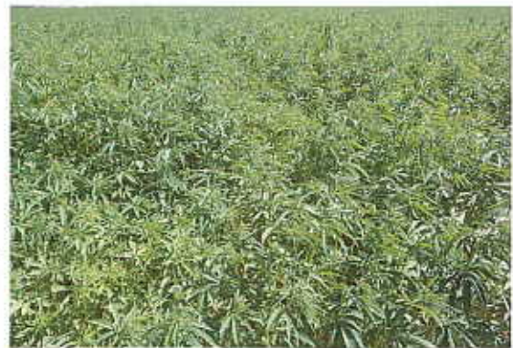
Des opportunités pour le chanvre en Ile-de-France

C'est dans ce contexte que nous vous proposons une enquête destinée aux agriculteurs visant à avoir un état des lieux des cultures BNI à travers les intérêts qu'elles présentent et surtout les freins techniques et économiques à leur développement. Une seconde enquête sera ensuite réalisée auprès des acteurs économiques des filières.