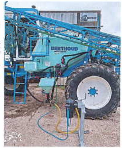
Dispositif Easy connect

Cet événement était organisé par AgroParisTech sur la ferme expérimentale de Grignon (78) le 23 mai. La principale innovation en lien avec les phytos présentée, et dont nous nous étions déjà fait l'écho, est le dispositif Easyconnect. Ce système permet de préparer la bouillie du pulvérisateur sans avoir à verser le produit dans la cuve. Il est proposé par un ensemble de firmes phytopharmaceutiques. Les tests ont permis de réduire de 95% l'exposition de l'utilisateur. Le coût est de 2 500 €.