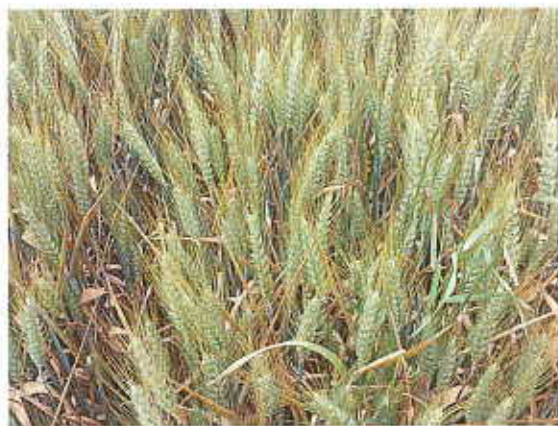
CHEVIGNON non traité (à gauche) - COMPLICE non traité (à droite)