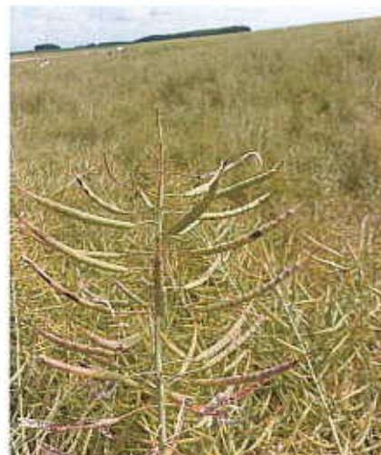
Maladies sur siliques

se sont mobilisés pour répondre à cette problématique, avec le projet PRECOTION, qui a débuté en 2022 et se terminera fin 2024. Depuis le début du projet, 12 essais (4 en 2022/2023 et 8 en 2023/2024) ont été mis en place en France, en vue d'évaluer une méthode de contamination artificielle en utilisant des grains de millet infectés. Cette