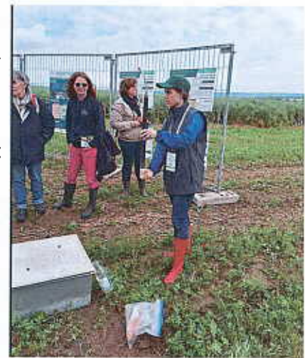
Présentation du projet Trajectoire

Concrètement, tous les itinéraires techniques visent un objectif de baisse de l'IFT par rapport à la référence régionale calculée sur la base de données d'IFT de la période 2011-2014. S'ajoutent des ambitions en termes de réduction d'émissions de gaz à effet de serre, de stockage du carbone et d'amélioration de la biologie du sol, etc.