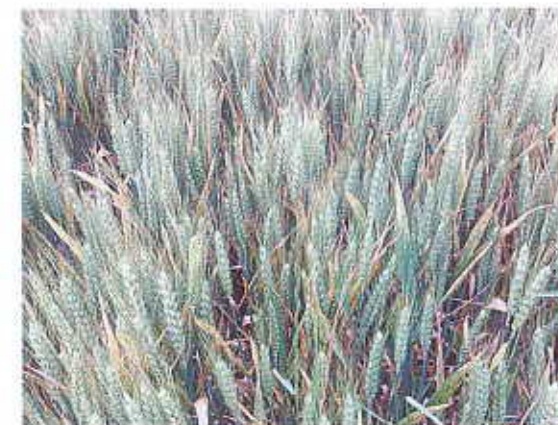
SHREK non traité (à gauche) - INTENSITY non traité (à droite)