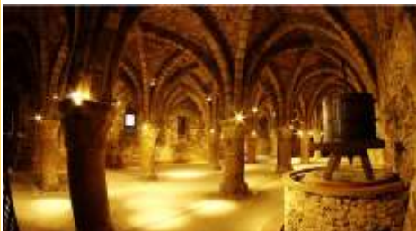
La salle des pressoirs