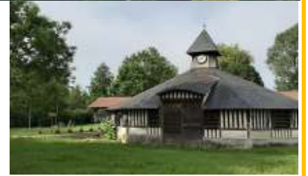
Le conservatoire des meules et pavés

Pour en savoir plus : https://ville-epernon.fr/decouvrir/patrimoine-et-histoire/lieux-remarquables/