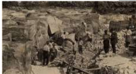
Les carrières et le front de taille